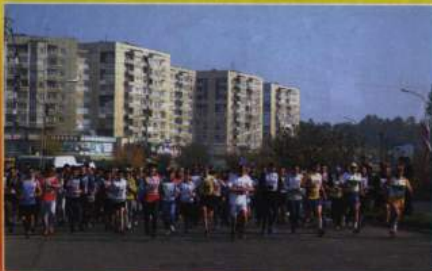
Пробег «Советск — Зима - 2016»