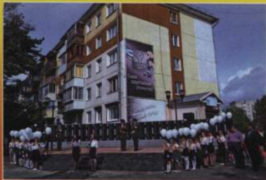
Церемония открытия Стены Памяти в Схвере ветеранов, 2018 г.