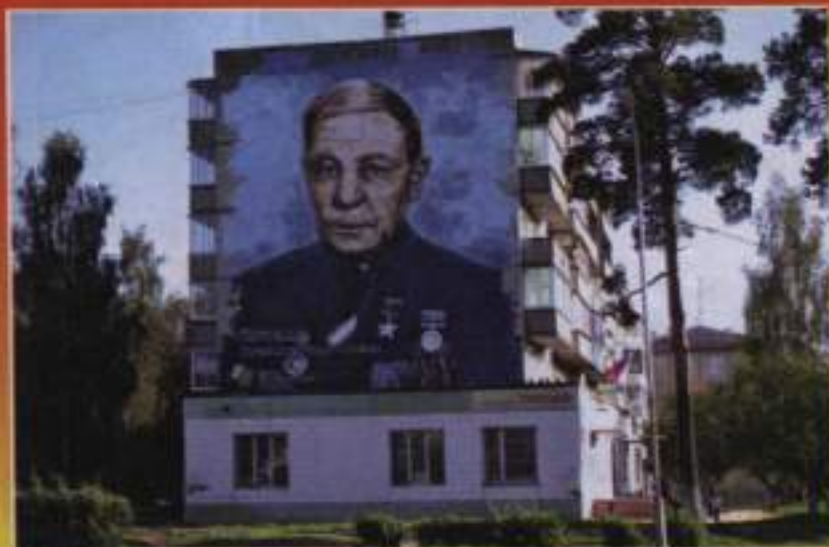
Портрет Героя Советского Союза Дмитрия Михайловича Перова на фасаде дома №14 микрорайона Олимпийский. 2019 г.