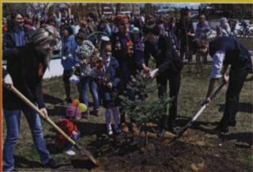
Посадка голубых елей в сквере Ветеранов. 2015 г.