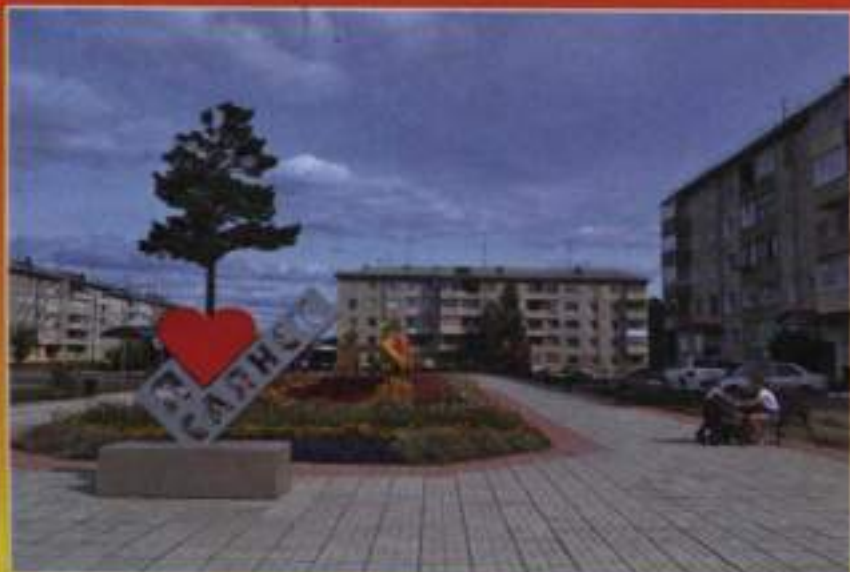
Парк «Зеленый», 2018 г.