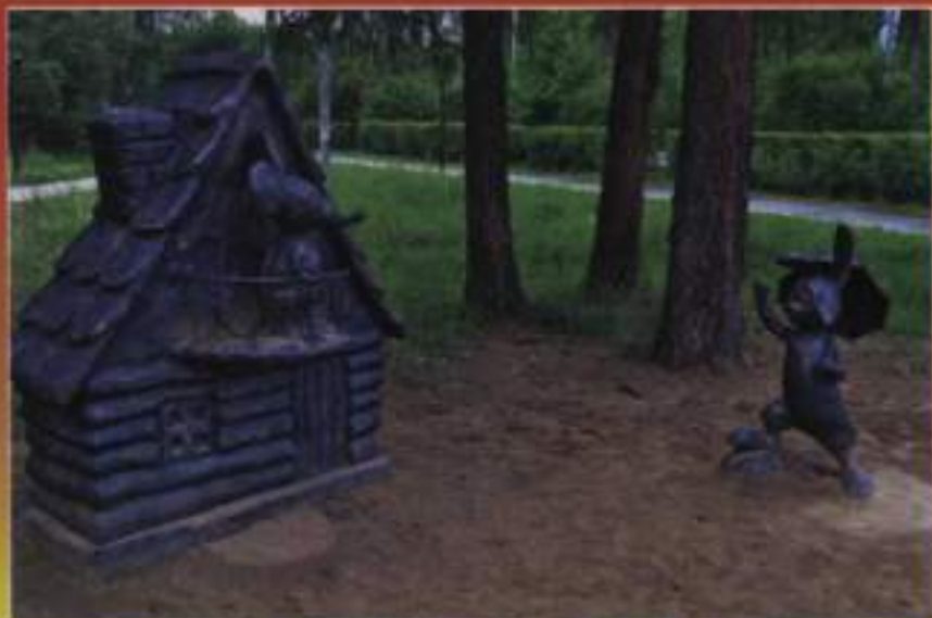
Региональный фестиваль — конкурс скульптуры «Добродел — 2017»