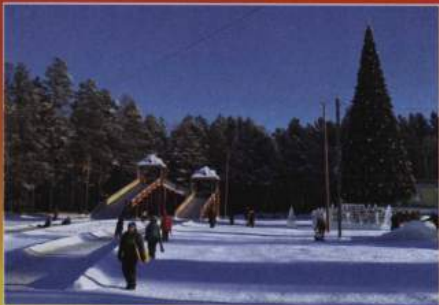
Обновлённый Снежный городок. 2015 г.