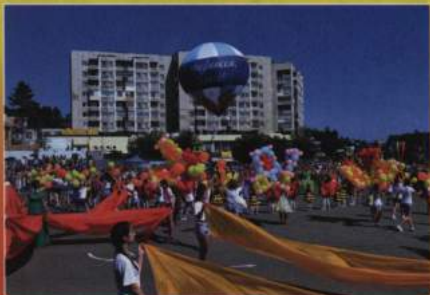
День города, 2017 г.